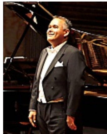
► Javier Camarena debutará mañana en el MET.

Su cita en el Metropolitan Opera House de Nueva York es