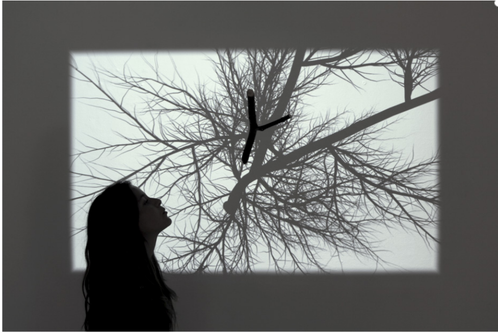
Rafael Lozano-Hemmer. Bifurcación, 2012.

El título de la exposición es una referencia a los automatismos surrealistas, una práctica artística que apostaba al poder creativo del subconsciente y se sostenía sobre la noción de valor en lo accidental y lo aleatorio. Lozano-Hemmer amplía esta noción planteando la imposibilidad de lo aleatorio en el universo maquínico, en donde cualquier pretensión de autonomía en un programa es tan solo una simulación. En palabras del artista, un pseudomatismo intenta hacer tangibles las predeterminaciones inherentes a esas simulaciones. Por definición el pseudomatismo es una acción casi-voluntaria: si el autómatas actúa “por sí mismo”, la obra de Lozano-Hemmer al contrario busca actuar “en relación”.