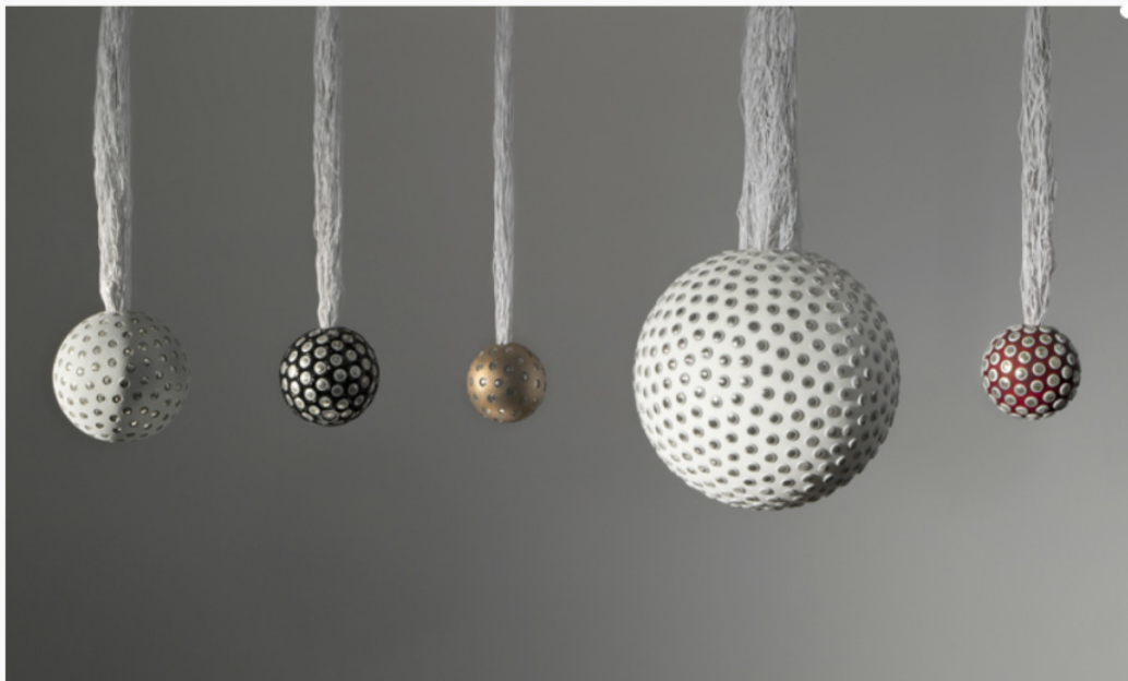
Rafael Lozano-Hemmer. Empaquetamiento de Esferas, 2014.