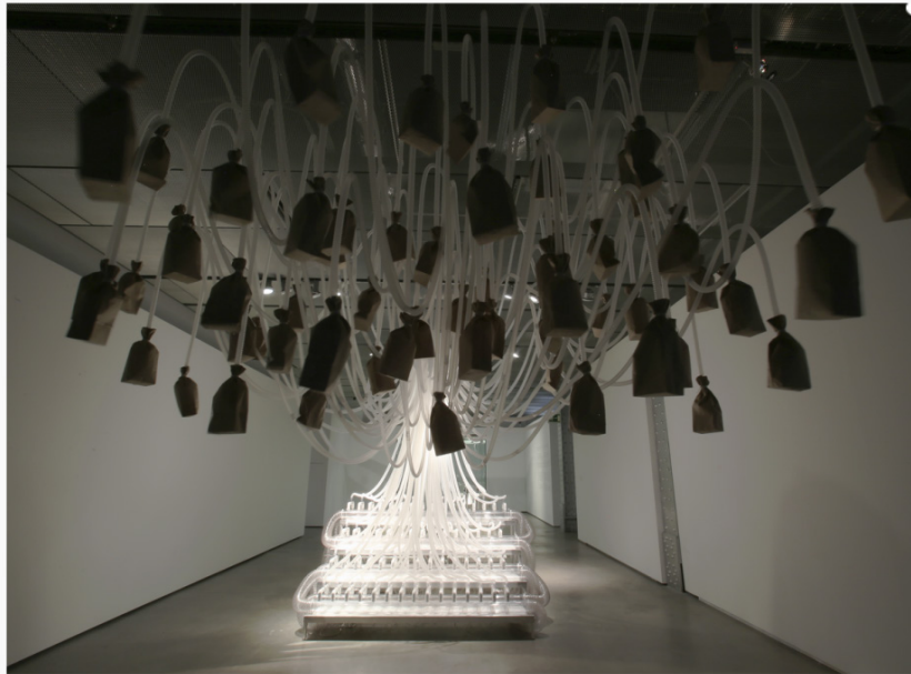
Rafael Lozano-Hemmer. Respiración Circular Viciosa, 2013.

El artista parte del entendido que la tecnología no es un instrumento o herramienta, sino una forma inevitable de determinación de subjetividad y sociabilidad. A partir del juego con el tacto, la vista, la respiración, el oído y el movimiento del público, la exposición busca activar relaciones entre máquina, entorno y percepción, para con ello mostrar el modo en que la tecnología, el cuerpo y el cuerpo-político son inseparables.