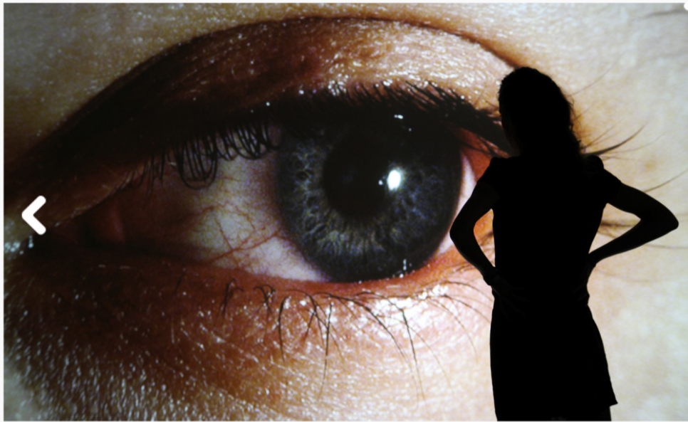
Rafael Lozano-Hemmer. Tensión Superficial, 1992.

Rafael Lozano-Hemmer (Ciudad de México, 1967, vive en Montreal, Québec) es un artista electrónico que desarrolla instalaciones interactivas que se encuentran en la intersección de la arquitectura y el arte del performance. Su interés principal es la creación de plataformas para la participación pública, pervirtiendo una amplia variedad de tecnologías de control.